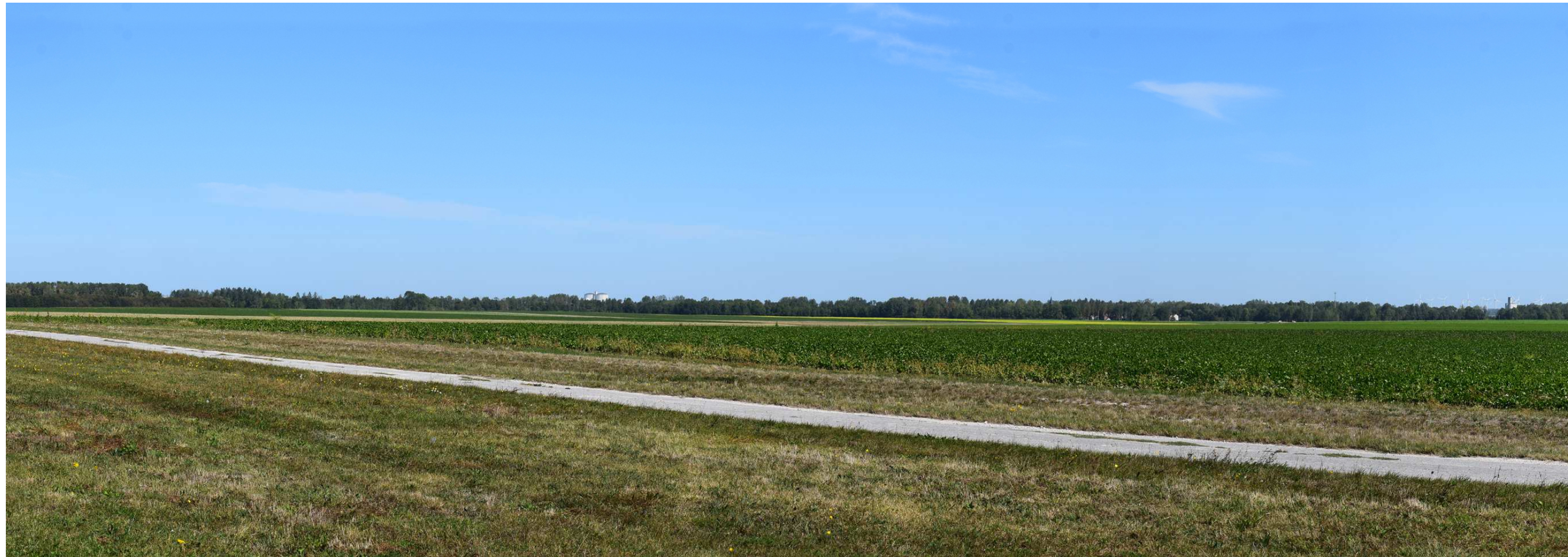
Le site actuel