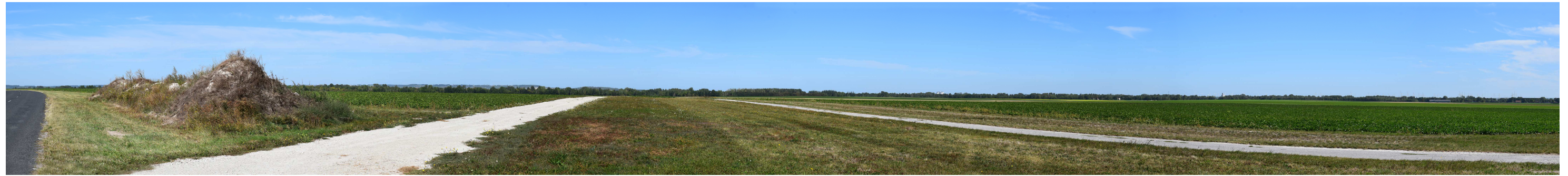
Le site actuel